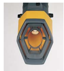
RotaHood® med arbejdslys